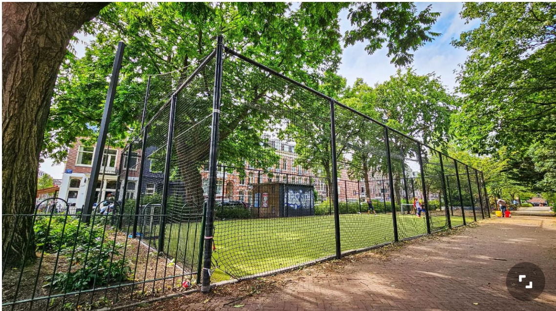
Nicolaas Beetsstraat (circa 20 x 10 m) met hekken en kunstgras. Hier zijn problemen i.v.m. geluidsoverlast voor de buurt.