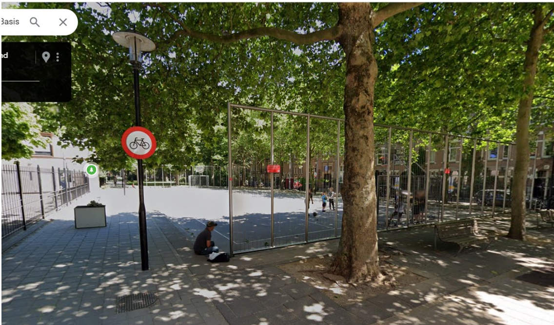
Basketbal- en voetbalcourt (ca. 30 x 15m) aan het Bilderdijkpark, naast school De Waterkant. Hekken bij de doelen, verharde ondergrond, op 2,3 km afstand.