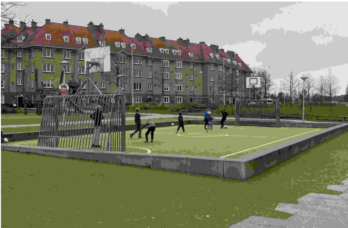
Houthavens ter hoogte van de Spaarndammerstraat (23 x 14 m) zonder hek, ook basketballen.