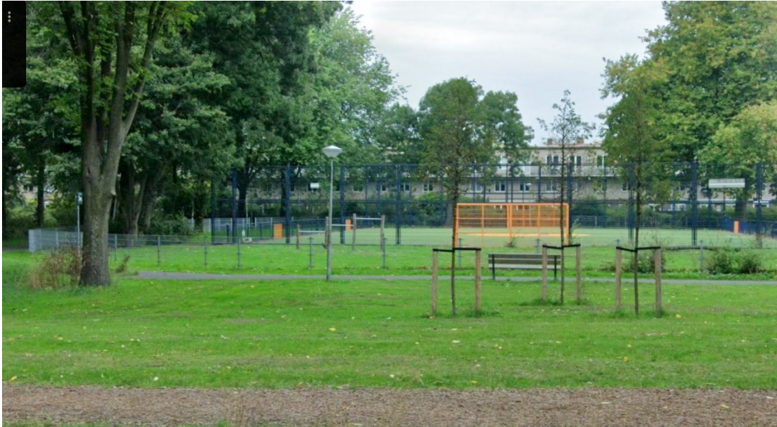
Kunstgrasveld aan de Buiksloterweg in Noord (circa 30 x 45 m) met hekken, doelen en bankjes.