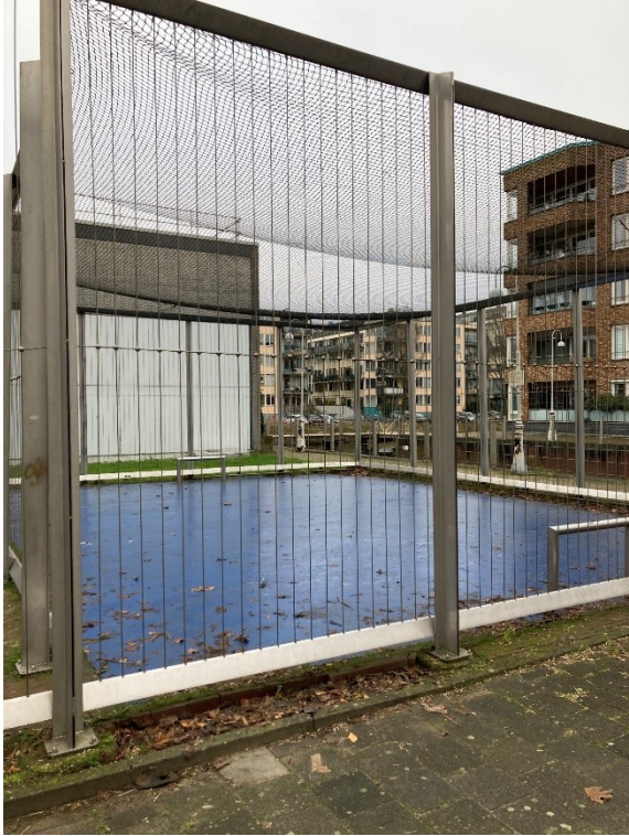
Westzaanstraat (12 x 10 m) met verharde ondergrond en hek rondom op 1,5 km afstand.