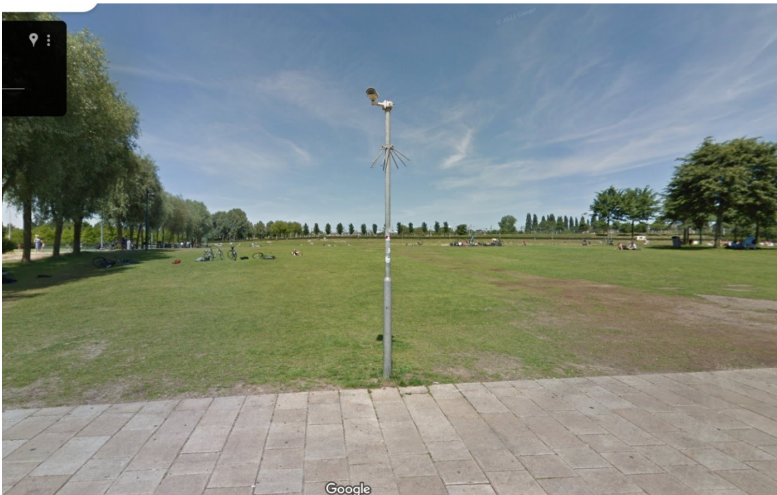
Grasveld in het Westerpark (circa 80 x 60 m) zonder hekken en doeltjes, met horeca.