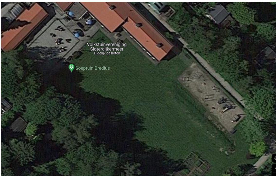
Groot voetbalveld op volkstuintuinpark Sloterdijkermeer (circa 50 x 30 m) Gras zonder doelen en hekken. Wordt verder nauwelijks gebruikt. Vrij toegankelijk van 1 april t/m 1 november van zonsopgang tot zonsondergang.