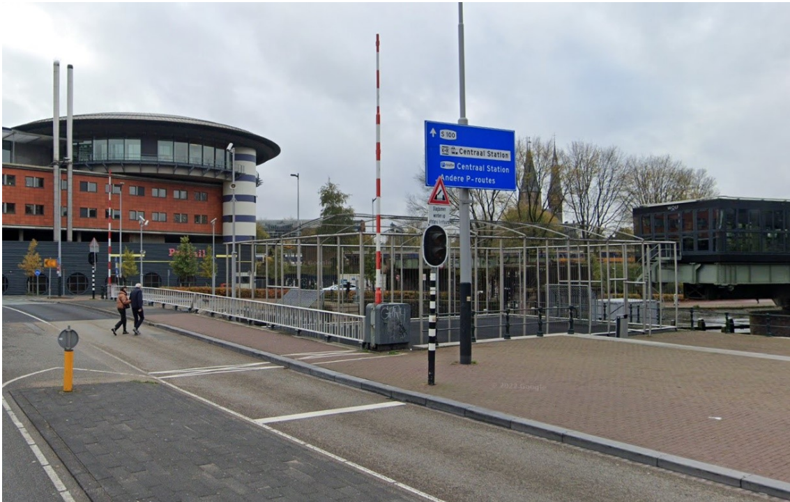
Westerdoksplein (circa 15 x 10 m) asfalt met hekken en doeltjes.

Ter vergelijking: de voetbalkooi bij de piramide is circa 24 x 16 m groot.