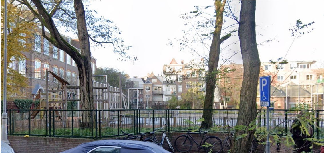
Noorderspeeltuin (circa 25 x 15 m). Tweede Lindendwarsstraat. Verharde ondergrond, hekken.