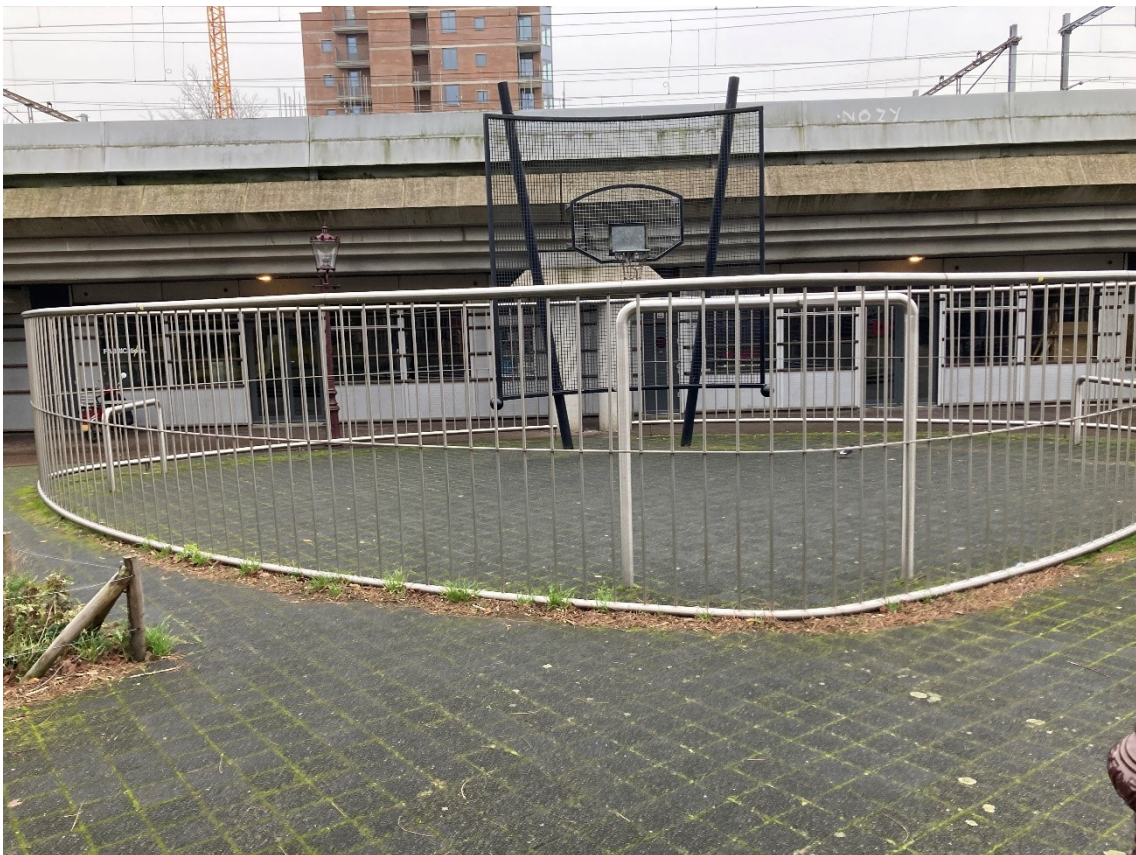
Hendrik Jonkerplein (circa 15 x 9 m) met laag hek rondom en een stenen ondergrond op 550 meter.