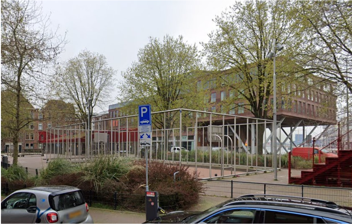
Barentzplein (circa 20 x 12 m) met verharding, toezicht vanuit speeltuin, tribune en hekken.