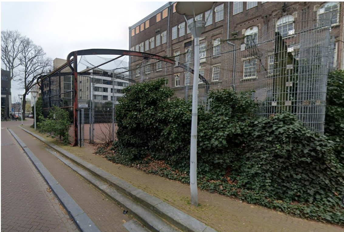
Voetbalkooi Geschutsweg nabij Hoogte Kadijk, verhard en met hekken en 'dak'.