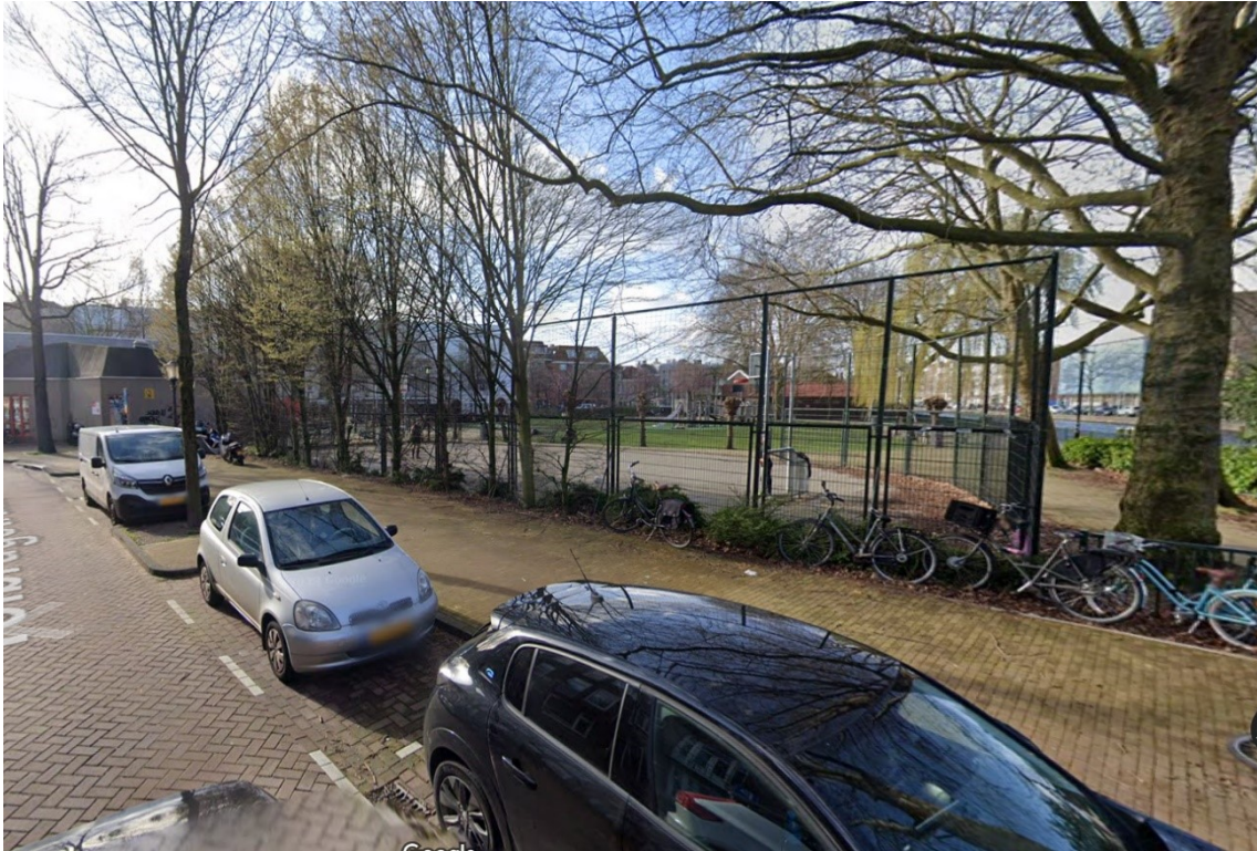
Tolbrugstraat (circa 25 x 15 m) met hekken en fietsenstalling.